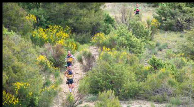
GORGES DU VERDON 26 MAI 2019