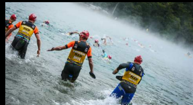
GRANDS LACS DE LAFFREY 25 AOUT 2019