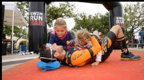
EMBRUN 30 JUIN 2019